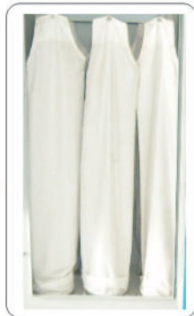
除塵袋 (可選用濾筒)