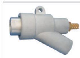
碳化硼噴咀配鋁槍